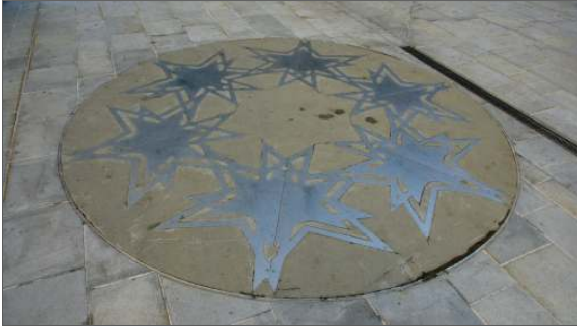
Schäden an weiteren Ornamenten